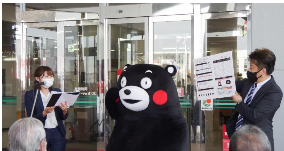
メディメッセ桜十字オープニングセレモニーにて結果報告書を紹介するくまモン